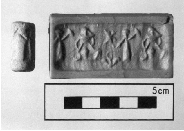
Demirçağı / Neo-Asur Dönemi fayans silindir mühür Iron Age / Neo-Assyrian period ceramic cylinder seal

kurulmasıyla yeniden canlanmıştır. Bu şirketler Kinet'in Eskiçağ'daki ekonomik amacını hatırlatan kuvvetli unsurlardır.