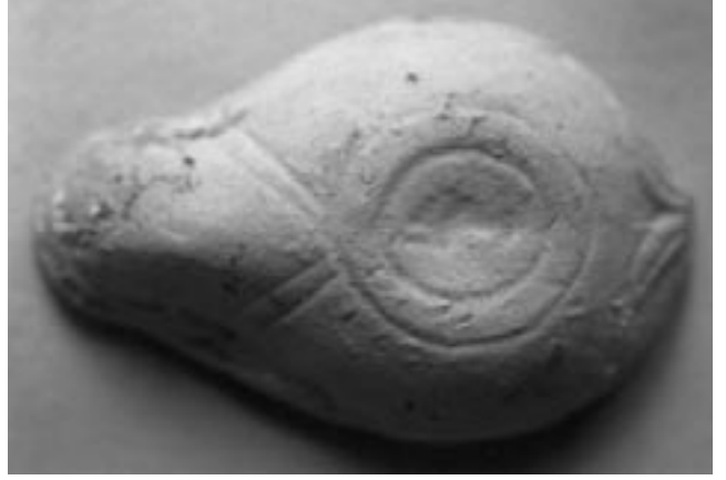
Res. 2 / Fig. 2

2003 yılında ortaya çıkarılan Bizans sırlı seramikleri arasında ince sgraffito, sgraffito, kazıma, champleve-kazıma ve boyama teknikleri ile karşılaşılmıştır. En yoğun grubu ise Ege Kapları oluşturmaktadır. Bu grupta yer alan kaplardan birinin parçaları üzerinde bir kuş figürünün başı ve ağzında taşıdığı bitki görülmektedir. Demre'de önceki yıllarda ortaya çıkarılan örneklerde