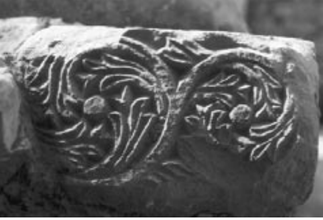
Res. 1 / Fig. 1

dışa bakan yüzü profillidir; ancak taş set kaldırıldığında bu parçanın üzerindeki “tabula ansata” yazıt ortaya çıkmış ve lento'nun orijinalde devşirme bir lahit parçası olduğu anlaşılmıştır.