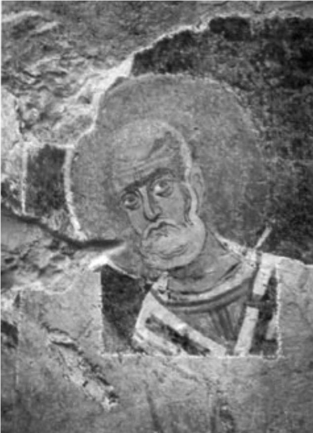
Res. 3 / Fig. 3

Kilisenin güneyindeki mezar odasında Aziz Nikolaos'un yaşamına ait 16 sahne ve 4 bayram sahnesinin koruma ve onarım çalışmaları 2003 yılında bitirilmiştir. Azizin yaşamından Deniz mucizesi olan "Beytullahim'e Yolculuk"un tümü, "Çocuğu olmayan aileye Nikolaos'un yardımı" sahnesinden azizin portresi (Res. 3), "İsa Golgota Yolu'nda" sahnesinden bazı figürler, ayrıca üçüncü güneydoğu şapeldeki "Deesis"teki Meryem figürü ve Piskopos Eleutherios rötuşlanmıştır.