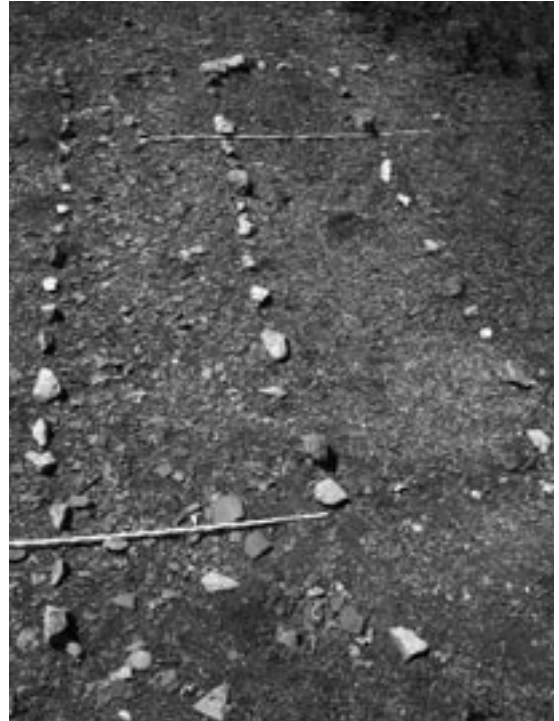
Res. 4 Seramik araştırma alanı Fig. 4 The ceramic survey area

The first area was at the eastern end of the Plakoma plaza, to the north of the great cistern. This area was selected because of the large number of potshards on the surface. An area of 10 square-meters was marked here (Fig. 4) and all the potshards of a minimum size of 3 cm. were collected. This area, termed ZNO/1, produced 1481 pieces of ceramics. Our studies showed