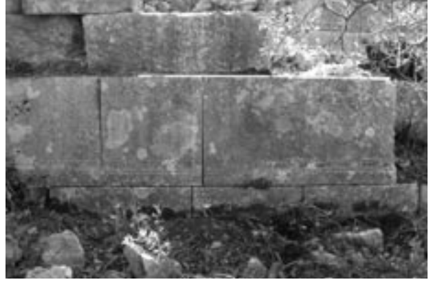
Res. 3 Liman bölgesindeki antik yapı kalıntıları Fig. 3 Ancient remains in the harbour area

Her iki yapıdaki bazı yapım tekniğine ait benzerlikler ve taş ustalarının işaretleri, Granarium ve meydan yapısının aynı zamanda inşa edildiğini ve her ikisinin de aynı yapı programı içinde yer aldığını göstermektedir. Yapının revaklı bölümlerinde yıkık ve dağınık halde bulunan bir yanı konsol olarak çalışılmış atkı levha blokları, meydanı çevreleyen mekanların iki katlı olduğunu göstermektedir. Kuzey revakta duvarların ince bir işçilikle tamir edilip tekrar inşa edildiklerine dair ipuçlarına rastlanmıştır. Bu restorasyon çalışmaları olasılıkla Geç Antik Dönem'de yapılmışlardır. Bugün meydanın kuzeydoğu köşesinde yüzeyde görülen duvar kalıntısı sütun fragmanları gibi çeşitli devşirme malzemelerle yapılmıştır ve Antik Dönem sonrasına aittir. Bugün, olasılıkla Mureks yığınlarının altında kalmış olan stylobatın asıl yüksekliğinden çok daha yüksek bir seviyede olduğu kesindir.