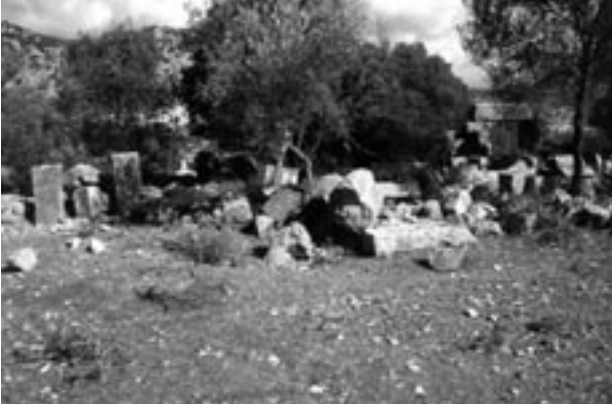
Res. 2 Meydanın kuzey bölümü Fig. 2 The north part of the plaza

ölçüm noktası belirlenmiş ve bu 1:50 ölçeğinde yapılan çizim için baz olarak alınmıştır. Meydan bugünkü görünümünde, doğu, batı ve kuzeyinde yer alan ve orijinalinde revaklı olan mekanlarla sınırlanmıştır (Res. 2). Bu mekanlara ait yatay kesiti yürek biçiminde olan köşe sütun fragmanları halen görülebilmektedir. Meydana çıkış, yapının kuzeyinde tam ortada yer alan anıtsal bir kapı ile sağlanıyordu. Bu girişin ön kısmında olasılıkla saçaklı taşıyan sütunlar vardı. Meydanın güneyinde bir metre yüksekliğinde, doğu ve batı revaklarını kısmen kaplayan Mureks kabuğu yığınları görülmektedir. Bu konuyla ilgili olarak 2004 yılında Viyana Veterinerlik Üniversitesi'nden Prof. Dr. G. Forstenpointner bir araştırma yapmış ve sonuçlarını 2004 yılı raporunda yayınlamıştır. Yukarıda bahsedilen kabuk yığınlarından dolayı meydanın güneyinde de mimari bir sınır var mıydı yoksa sadece bir açık alan mıydı sorusunu cevaplamak kazı yapılmadan veya yardımcı teknik araçlar kullanılmadan sadece yüzey buluntuları ile mümkün değildir.