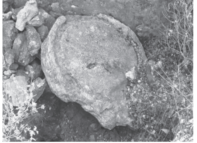
Res. 3 Kargıcak-Yerleşim, zeytin işliği-ezme taşı Fig. 3 Kargıcak settlement, olive work-area, grinding stone

Önümüzdeki yıl Alanya ve çevresindeki Bizans yerleşim ve yapılarında belgeleme ve değerlendirme çalışmalarımız sürdürülecektir.