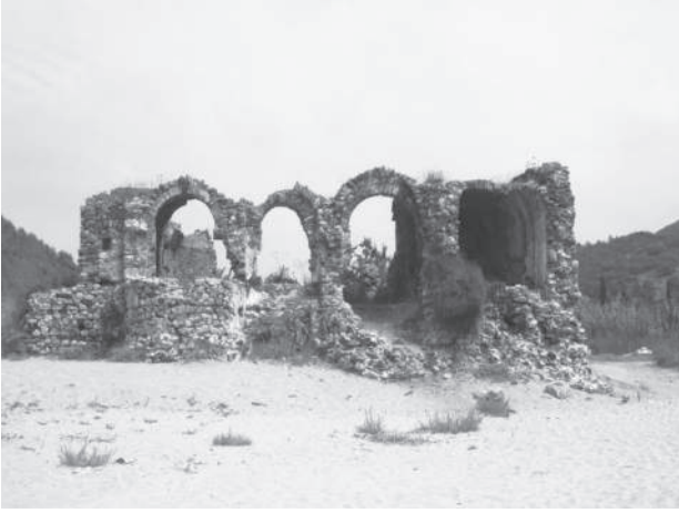
Res. 1 Konaklı / Aunesis-Hamam