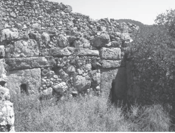
Res. 2 Kargıcak-Yerleşim, zeytin işliği Fig. 2 Kargıcak settlement, olive work-area

gelememiştir. Doğuda içte ve dışta yarım daire biçimli apsis ile doğu duvarların tamamı, kuzey duvarın doğu bölümü ayakta olup, güney duvarın yalnızca dış hattı izlenebilir. Batıda ise küçük bir duvar yıkıntısı kalmıştır. Naos, 14.11x28.74 m. boyutlarında restitüte edilmiştir.