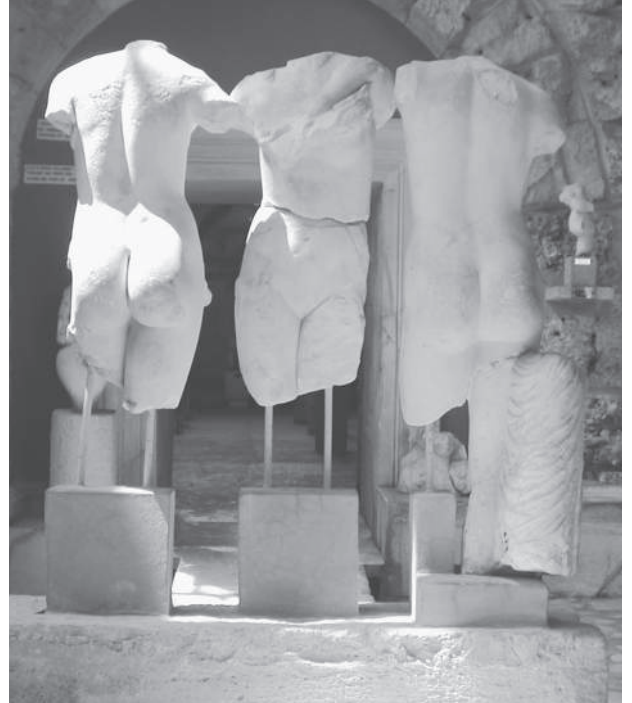
Res. 4 Üç güzeller

Sürdürülen onarım ve restorasyon çalışmalarında 2004- 2005 yıllarında Akdeniz Üniversitesi Arkeoloji