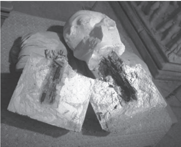
Res. 1 Demir korozyonu Fig. 1 Corrosion