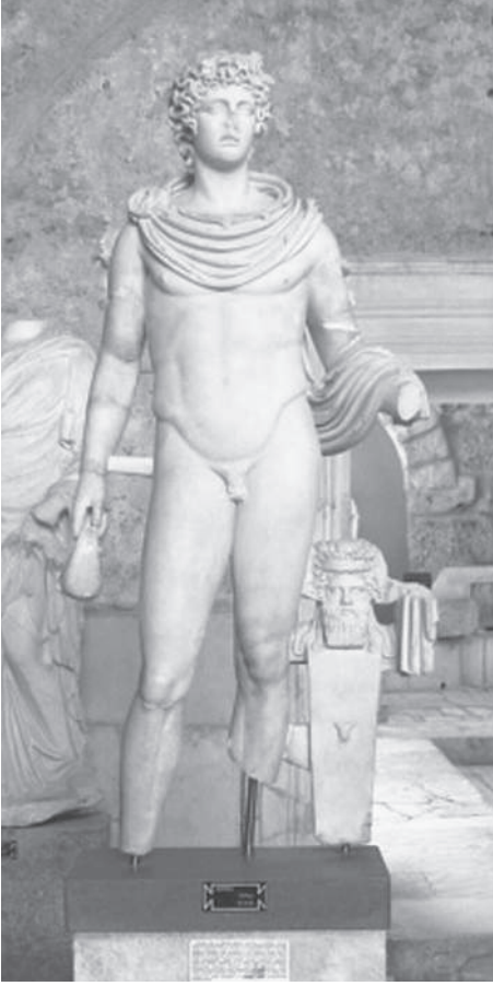
Res. 3 Hermes, restorasyon sonrası