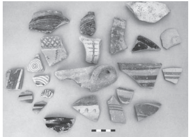
Res. 4 M 20 plankaresinde bulunan Demir Çağ seramikleri Fig. 4 Iron Age pottery uncovered in the grid-square M 20

The main scope of the 2006 campaign was to identify the hitherto least-known three phases at Yumuktepe. This would also greatly contribute to the open-air museum we hope to establish at Yumuktepe. Thus, the goals of the prehistoric studies in 2006 were identified as follows and the work was conducted accordingly: To reach the Early Neolithic (EN) levels, to clarify the house plans and their construction technology. In order to reach the EN levels, a trench of 9.00x5.00 m. in the grid-squares E 3 and F 3, to the northeast of the room with Middle Neolithic stone foundations in the Trench EBA. As this area is located on the slope, it was damaged by erosion, by the terracing activities of later periods and from the pits dug into it. In the EN levels, no evidence for the use of stone foundations