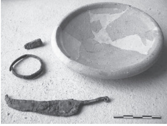
Res. 5 Geç Tunç Çağı'na ait buluntular