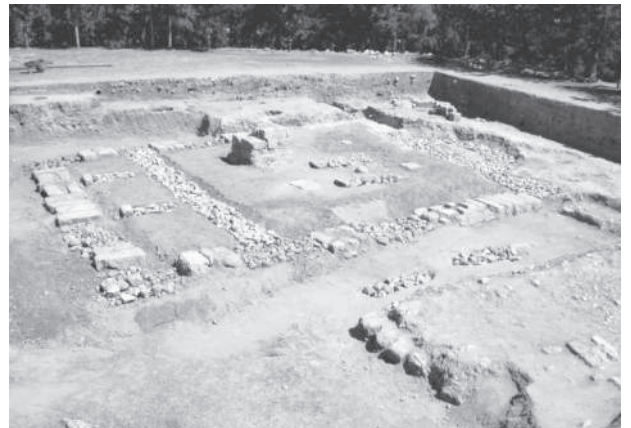
Res. 1 Yumuktepe Kilisesi, 11-12. yy.

In the grid-squares P 14 and 15, pits for placing storage jars cut into earth and lime mortar floor were uncovered in the storage area identified as such in 2005. During the course of the 2006 campaign in this area, agate beads (biconic and flat round), a bone spindle whorl with incised decoration and coins of the 11 th -12 th centuries were uncovered beneath the floor.