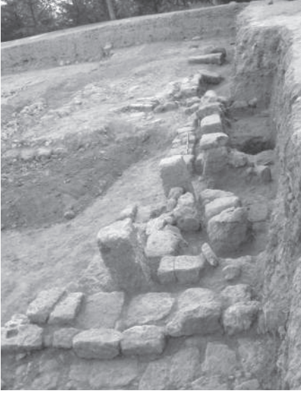
Res. 2 P 13-14-15 plankarelerindeki mimari kalıntılar