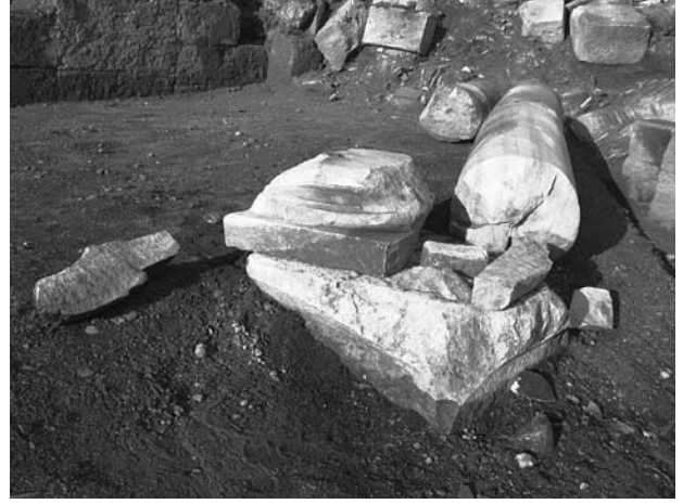
Res. 4 Sütun ve kaidesinin onarım öncesi görünümü Fig. 4 Column and base prior to restoration

M Binasına giden portikli yolun ön cephesinde yer alan ikinci postament üzerinde duran mermer sütun portik üzerine düşerek üç parçaya ayrılmış, sütun kaidesi ise aksi yöne devrilmiştir. Kazı sırasında sütuna ve kaidesine ait kırık parçalar toplanarak numaralandırılmıştır (Res. 4). Ancak sütunun dip kısmına ait yonga şeklinde kırıklar olduğundan ele geçen bazı parçaları yapıştırılarak onarılmıştır. Ancak bu alanda yapılacak kazılar bitirildiğinde onarımı tamamlanabilecektir.