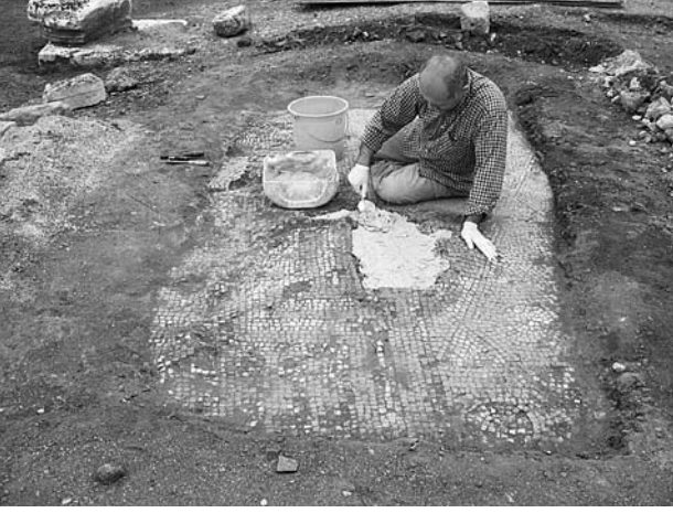
Res. 3 Mozaik onarımı Fig. 3 Mosaic repair work

M Binası'na giden yolun kuzey tarafında, geç dönem suru önünde sonradan eklenen 2.5 m. genişliğindeki mekanlar portikli yola açılmakta ve postamentler portikli yolun ön cephesini oluşturmaktadır. Portik zemininde geometrik bezemeli mozaik taban bulunmuştur.