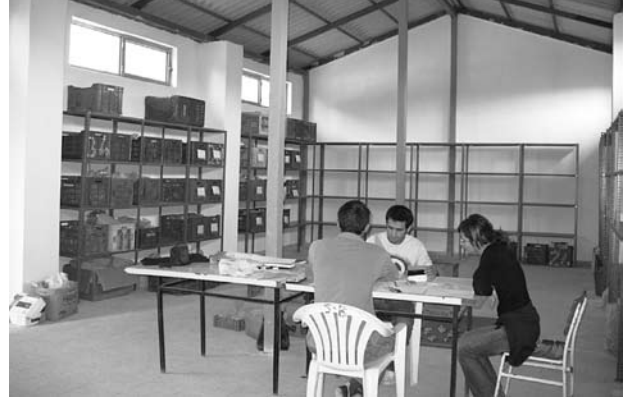
Res. 5 Agora deposunun içeriden görünümü

Daha önceki yıllarda Kazı evi deposu ve Tiyatro Galerisi (E) deposunda bulunan pişmiş toprak buluntular etüt edilerek sistemli ayrımları ve çizimleri yapılmış ve yeni depoya taşınmıştır. Çeşitli malzemeden oluşan etütlük küçük eserler tekrar gözden geçirilmiştir. Kazı evi deposuna getirilerek etüt edilen keramiklerin çizimlerine devam edilmiş, özellikle büyük bir grup oluşturan terra sigillata keramikler ayrıntılı olarak incelenmiş, Munsell Renk Kataloğu'ndan renkleri belirlenerek envanteri hazırlanmıştır.