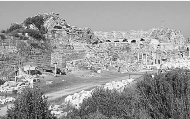
Res. 2 Kazı alanı, genel görünüm Fig. 2 General view of the excavation area

gelmiştir. Tiyatronun özgün yapısı ile geç dönem suru arasındaki bağlantıyı araştırmak amacıyla 2006 yılında bu alanda kazı çalışmalarına başlanmıştır. Bu yıl sur yapısı ile Doğu Kapısı arasında yoğun dolgu olan alanda \pm 4.35 kotundan başlayarak \pm 0.00 kotuna kadar inen çalışmalar sonucu, tiyatro sahne binasının dış duvarına ait olduğu sanılan mimari elemanlar açığa çıkarılmıştır (Res. 2). Bunlardan kemer parçaları, hafifletme kemerlerinin iç kısmına ait yarım daire blokları, arşitrav blokları, tiyatroya ait oturma sıraları, profili düzgün duvar elemanları sayılabilir. Buradan çıkan iki mimari parça etüt-lük olarak depoya kaldırılarak koruma altına alınmıştır. Bunlardan biri üzerinde çelenk içinde yazıt bulunan bir blok, ikincisi ise üzerinde alçak kabartma kalkan betimi olan bir bloktur. Bu alanda Geç Roma, Erken Bizans Dönemi'ne ait çanak çömlek, cam, metal çivi, çatı kiremidi parçaları ve hayvan kemikleri bulunmuştur.